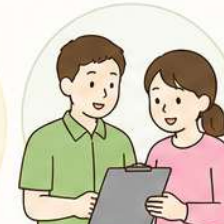
対応手順の共有・確認