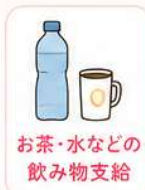
お茶・水などの飲み物支給