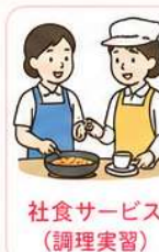
社食サービス(調理実習)